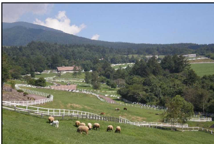
山梨県立まきば公園

先ずは、 1日目 に八ヶ岳牧場の一部を開放してつくられた、雄大な自然と広大な緑の牧草地の中で動物たちと触れあいが出来る「山梨県立まきば公園」を訪問、そこで景色を眺めながら昼食を摂り、約1時間(標準30分)掛けてほぼ一周します。