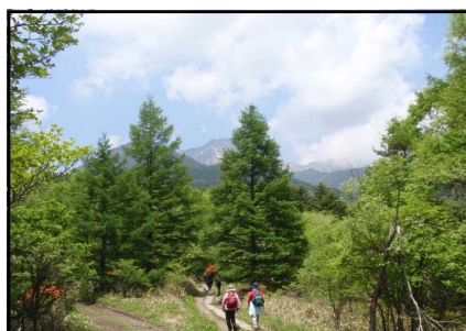
美し森ウォーキング

翌日の 2日目 は、日本3大奇祭のひとつに数えられ、数え年で7年に一度行われる長野県諏訪地方の御柱祭で有名な諏訪大社を参拝します。そして再び清里地区を訪